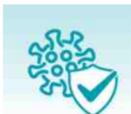
COMPROMISO DE REEMBOLSO COVID-19