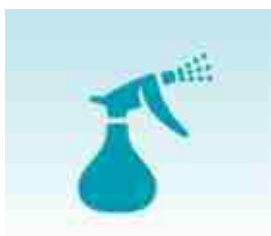
PROTOCOLOS DE HIGIENE Y LIMPIEZA