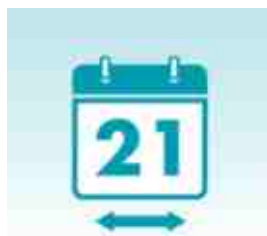
FLEXIBILIDAD DE TRANSFERENCIA