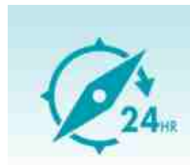
ORIENTACIÓN ESPECIAL 24/7